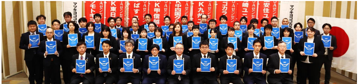
WAYは私たちと共にあります