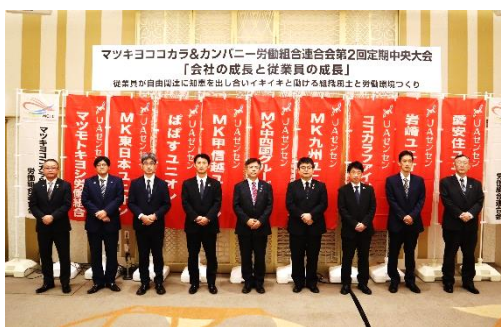
MC & C 労連中央執行委員三役