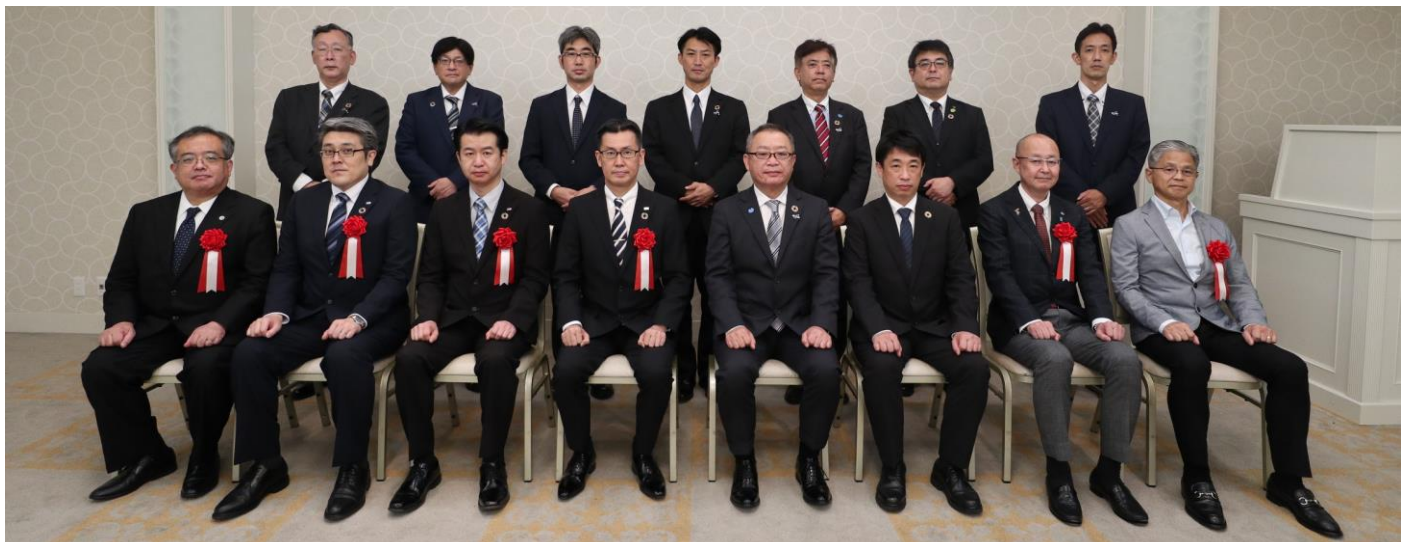
～ご来賓の皆様とMC & C労連中央執行員三役～