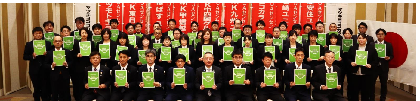
行動規範を私たちは遵守します