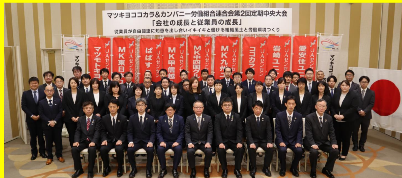
～大会会場出席集合写真～